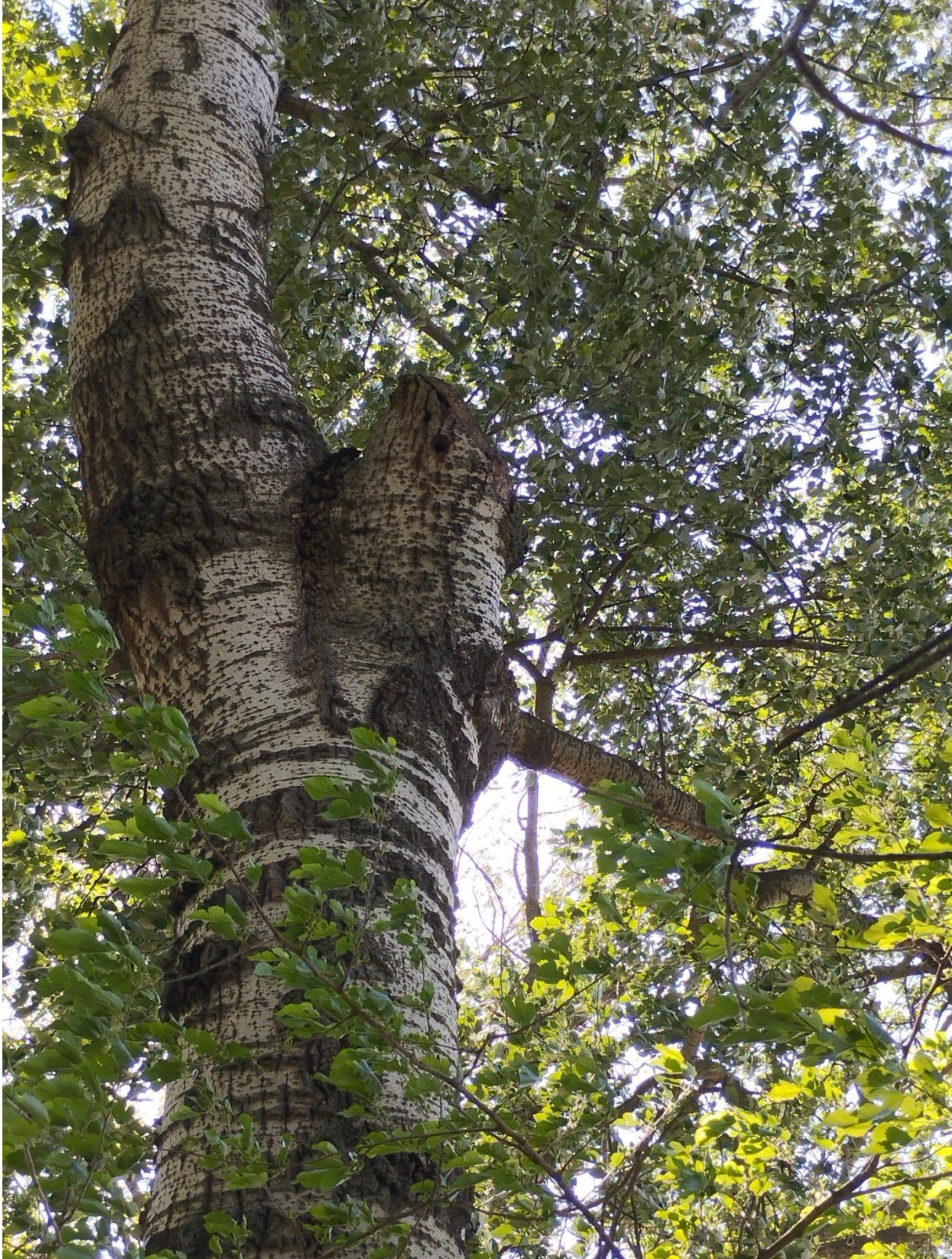
2. ábra: Korábban eltávolított tekintélyes vágás bütümetszete