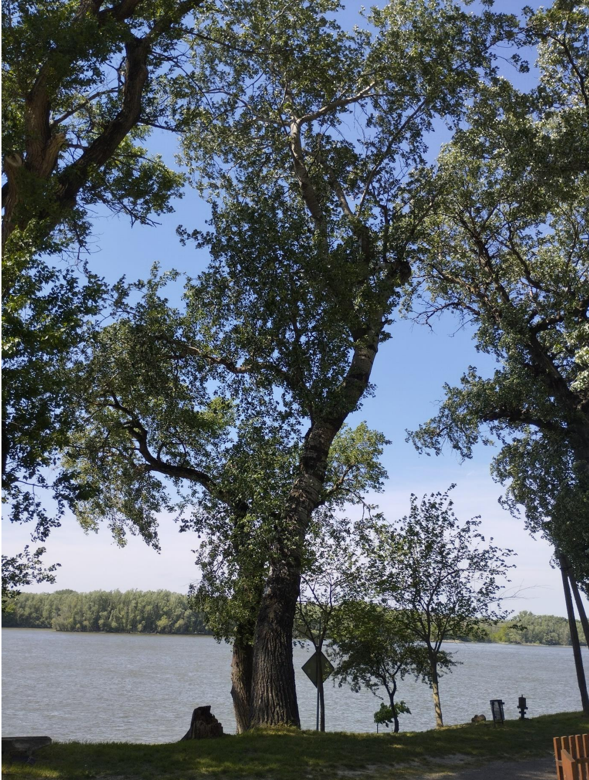
1. ábra: „X6 - VV02 Populus alba” teljes kép